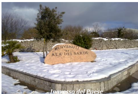
Ingresso del Paese